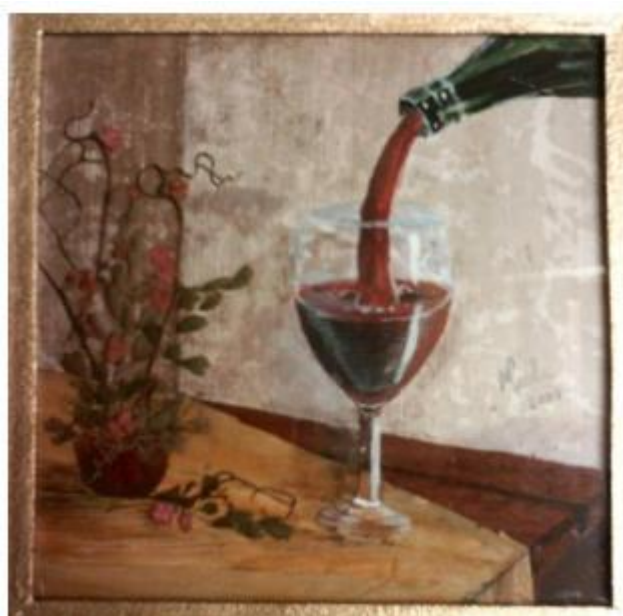
© Marta Paola. Llenando la copa

Obra realizada mediante la técnica de biocollage